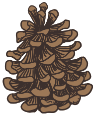
cocotte de pin