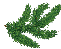
branche de sapin